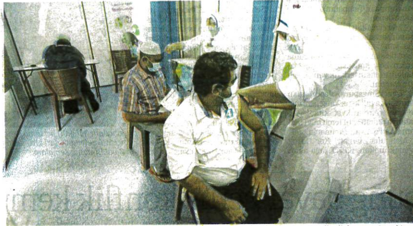
Orang ramai digalakkan mengambil suntikan dos penggalak di kemudahan kesihatan yang disediakan. (Foto hiasan)

Beliau berkata demikian bagi mengulas artikel yang diterbitkan