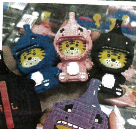
VAPE berbentuk mainan kanak-kanak yang tular di media sosial hingga mendapat kecaman ramai.