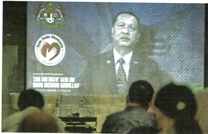
NOOR Hisham Abdullah menyampaikan ucapan menerusi rakaman video pada taklimat media Jangan Biarkan Osteoporosis Mematahkan Anda , kelmarin.

"Penyakit diabetes dapat menimbulkan perasaan takut dan bimbang dalam kalangan masyarakat, namun berbeza dengan osteoporosis kerana orang ramai tidak begitu mengambil berat tentangnya," katanya.