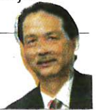
Dr Noor Hisham Abdullah, Ketua Pengarah

Tiada signal keselamatan menunjukkan pengambilan vaksin itu boleh menyebabkan strok iskemik, dikesan melalui lain-lain sistem pemantauan keselamatan di AS dan negara rujukan lain