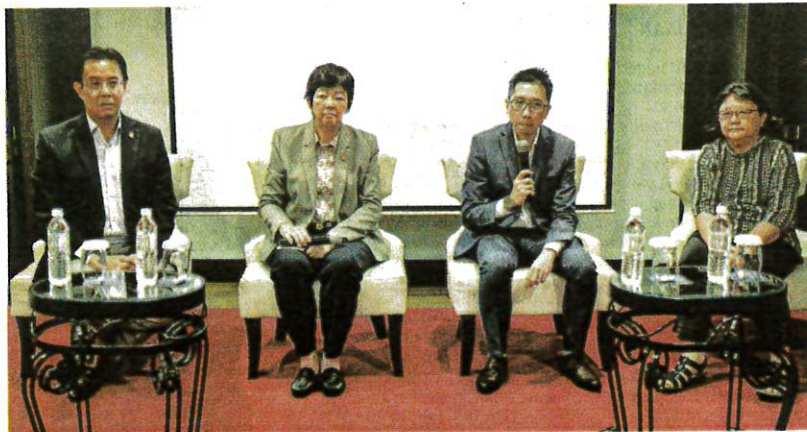
TAKLIMAT media Jangan Biarkan Osteoporosis Mematahkan Anda di Kuala Lumpur, kelmarin.

Menurutnya, baki 26 peratus atau satu daripada empat pesakit pula mati