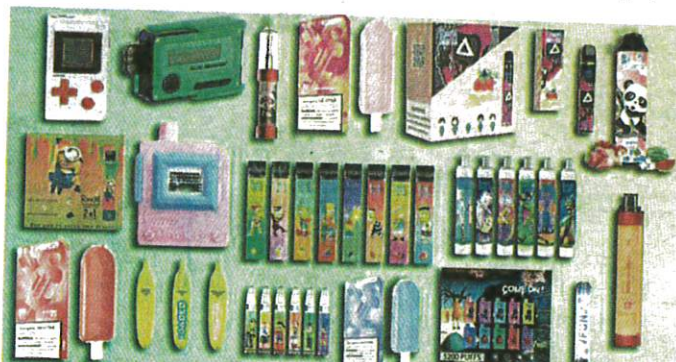
SEBANYAK 15.6 peratus remaja berusia 15 hingga 19 tahun didapati menggunakan produk tembakau.

"Nikotin diketahui amat berbahaya terhadap otak terutama bagi golongan muda sedang berkembang. Selain menyebabkan ketagihan, gejala menghisap vape dikalangan remaja turut me-